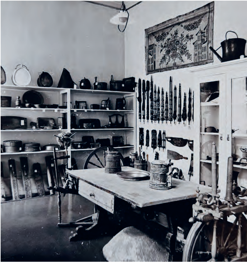
Allmogrummet, 1959.

fram till dess, precis som moderns sovrums intill. Rummet har sedan Akademiens övertagande använts som kontor.