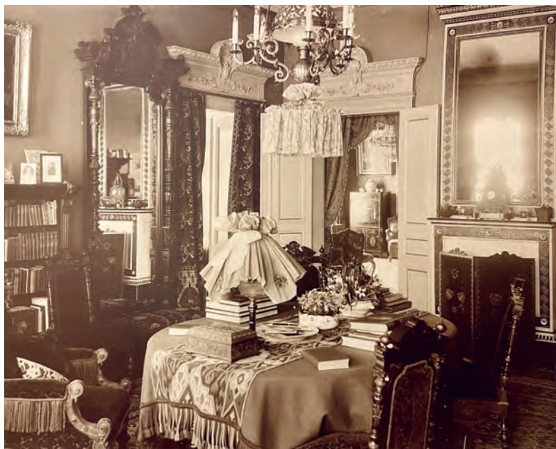
Arbetsrummet, tidigt 1900-tal.