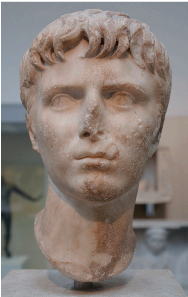
Marmorporträtt av Gaius Caesar. Från British Museum.