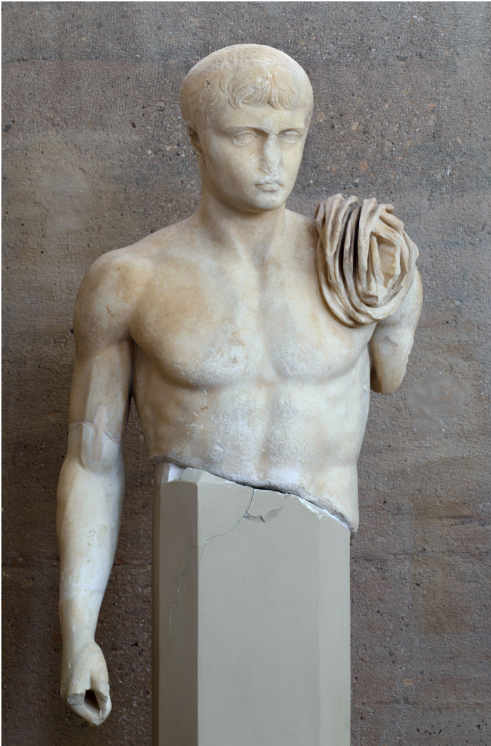
Porträttskulptur av Lucius Caesar. Från Arkeologiska museet i Korinth.