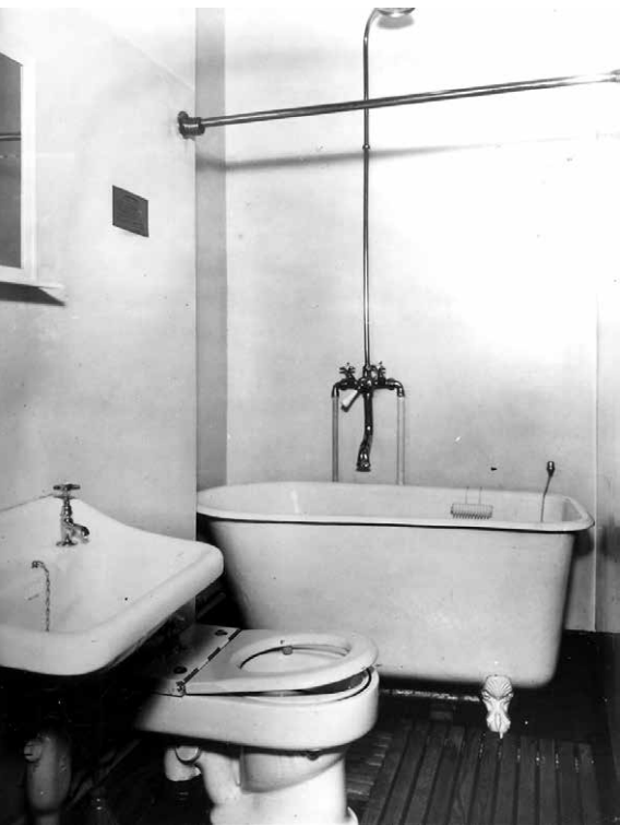
Badrum var en sällsynthet innan det sena 1800-talet och först på 1920-talet blev det vanligare med badrum som standard vid nybyggnation.