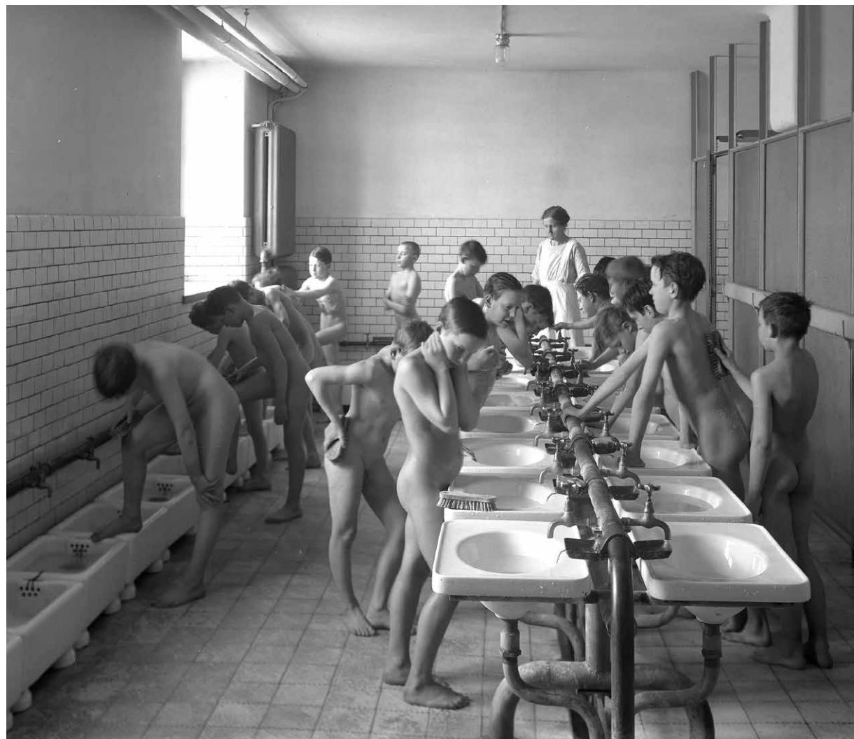
Under 1800-talets slut infördes skolhälsovård och allt fler skolor introducerade skolbad i ett försök att hantera smuts och ohyra hos barnen.

En målande beskrivning av skolmiljön ges av journalisten och propagandisten Elsa Tenow i skriften Renhet – en häftstäng för den enskilde och samhället från 1906: