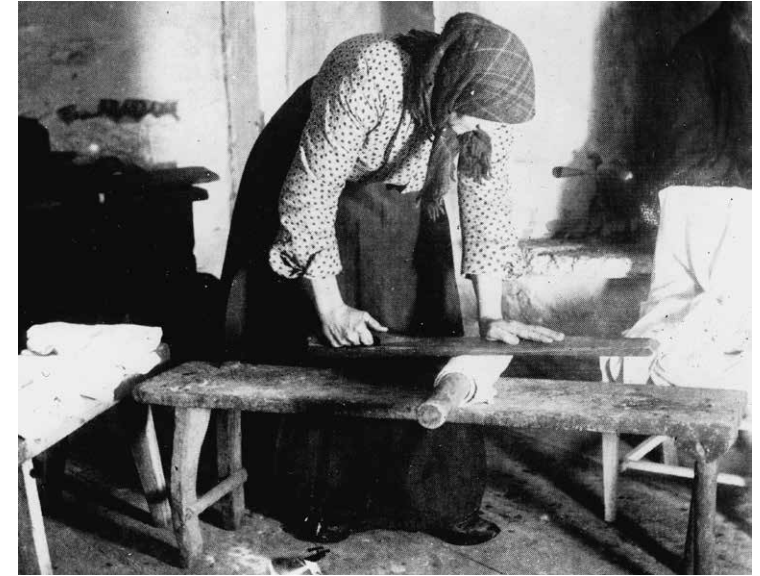
Manglingen var ett manuellt och tungt arbete. Vid handmangling rullades den fuktade textilen runt en kavel. Sedan tog man ett mangelbräde och pressade det fram och tillbaka mot kaveln.

Strykjärnet har varit i bruk sedan medeltiden. Tidigare använde man heta stenar eller glaskulor som tvätten pres-