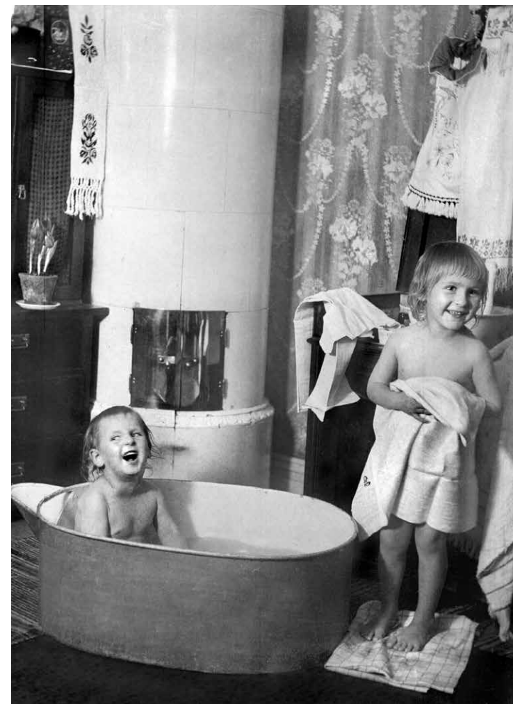
Innan badrummets entré i de svenska hemmen turades ofta familjemedlemmarna om att bada i samma vatten. Barnen i Karlskrona 1917 var en del av en tradition med lördagsbad som går att spåra långt tillbaka i tiden. Seden har till och med gett veckodagen dess namn (lögardagen).

Större luxuösa rum som kan liknas vid badrum fanns i enstaka exempel redan på 1600-talet, främst i slottsmiljöer, där badkar och kaminer tillhörde inredningen tillsammans med antika skulpturer och marmorornamentik.