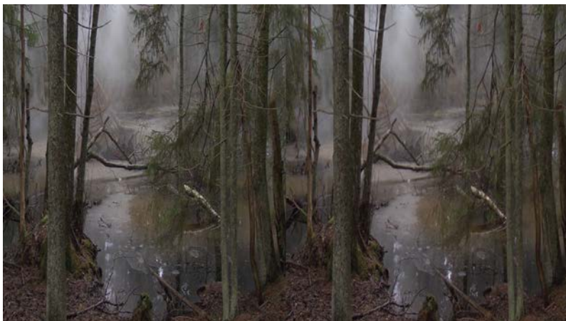
Lundahl&Seitl, An Elegy to the Medium of Film . Stillbild från film. De två bilderna från samma scen motiveras av publikens användning av 3D-glasögon, för stereoskopiska effekter.